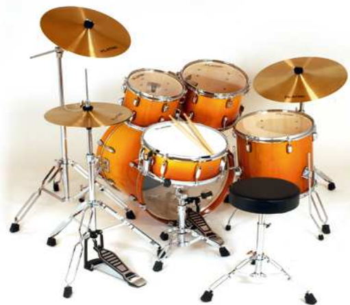
kombiniertes Schlagzeug (Set)