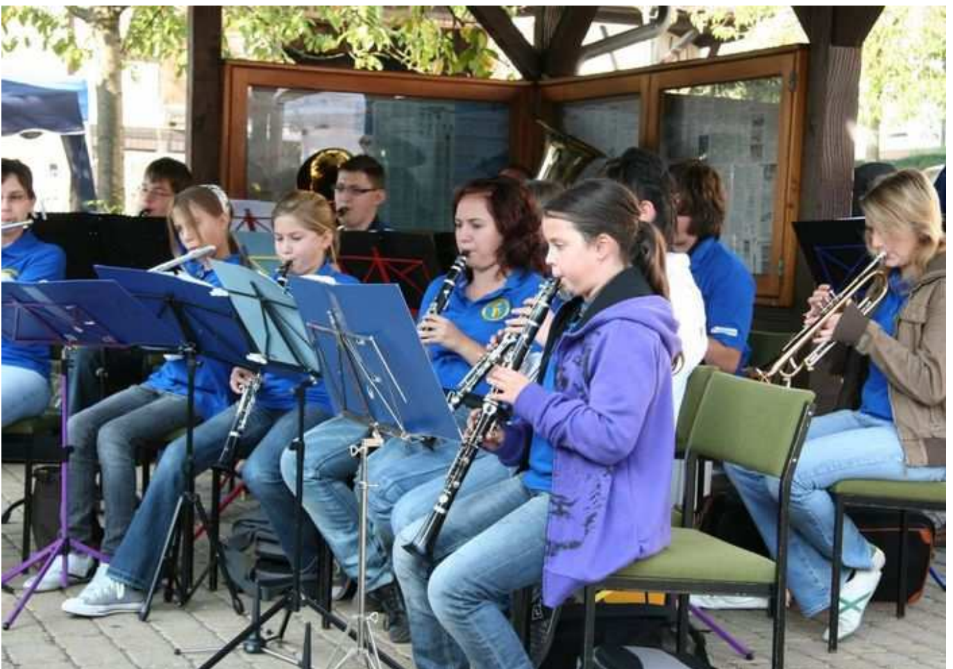
Unsere Mini-Juka auf dem Herbstmarkt 2009

Als Besonderheit bieten wir den Instrumentalschüler(innen) die Möglichkeit, schon sehr früh ihr Können in der Mini-Jugendkapelle unter Beweis zu stellen. Durch das koordinierte Lernen in der Gruppe steigt die Sicherheit - und Spaß macht es natürlich auch! Das Mitspielen in der Mini-Jugendkapelle (von uns Mini-JuKa genannt) ist kostenfrei. In öffentlichen Auftritten steigt die musikalische Sicherheit. Natürlich erst nach anfänglichem Lampenfieber. Zwischen Jugenddirigent(in) und Instrumentallehrern/innen findet eine enge Zusammenarbeit statt, die sich positiv und Erfolg versprechend auswirkt. Dies kommt wiederum ihrem Kind in der Instrumentalausbildung zu Gute, die Kinder machen allgemein schnellere und bessere Fortschritte. Außerdem finden in regelmäßigen Abständen Filmnachmittage, Spielnachmittage, Probesamstage, Eis-Essen vor den Sommerferien oder Ähnliches statt. Diese Aktivitäten sind bei unseren Jungmusikern/innen übrigens heiß geliebt, kommen dementsprechend gut an und fördern darüber hinaus schöne Freundschaften und eine tolle Gemeinschaft.